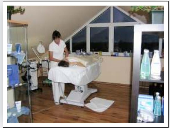
Thankfulness (高) (村) (例) (中) (例) (低) (低)